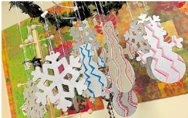
Schneemänner und Schneesterne gibt es auf dem Basar in der Insel der Künste.

Der Weihnachtsinsel-Basar in der Insel der Künste, Hafestraße 20, findet bis Sonntag, 12. Dezember 2021, statt. Geöffnet ist er samstags von 11 bis 16 Uhr und mittwochs, donnerstags und freitags von 15 bis 18 Uhr. kmu